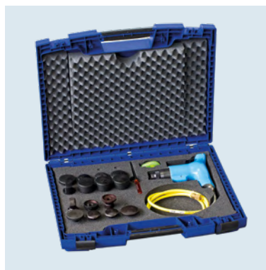
GL 2 MAX KIT 3 Tout dans une seule boîte.