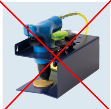
GL 2 KIT 1 Inserts pour planer, étirer et courber.

Cette référence n'est plus disponible au catalogue